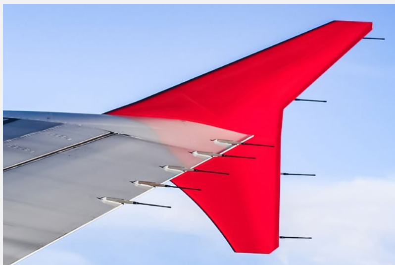
Молниеотводы на авиалайнере

Когда две поверхности трутся друг о друга, электроны переносятся с одной поверхности на другую. В полете самолет постоянно трется об атмосферу. Это трение приводит к накоплению статического заряда внутри планера. Избыточные электроны имеют тенденцию накапливаться в тонких задних кромках самолета, таких как концы элеронов, рулей, руля высоты, закрылки и т. д. Если заряд в различных частях самолета неоднороден, вероятность искрения увеличивается, что может привести к возгоранию.