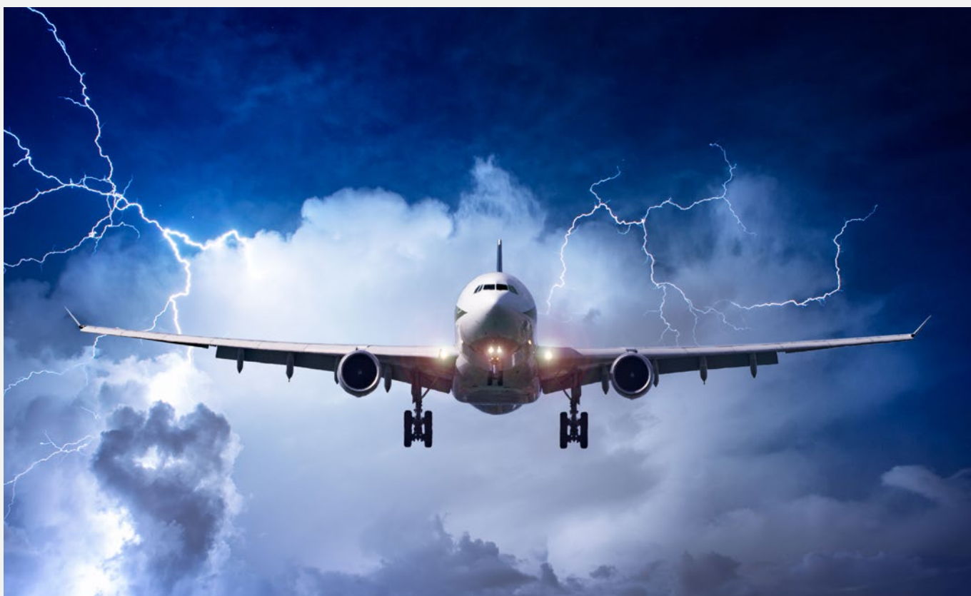
Опасность из-за молнии