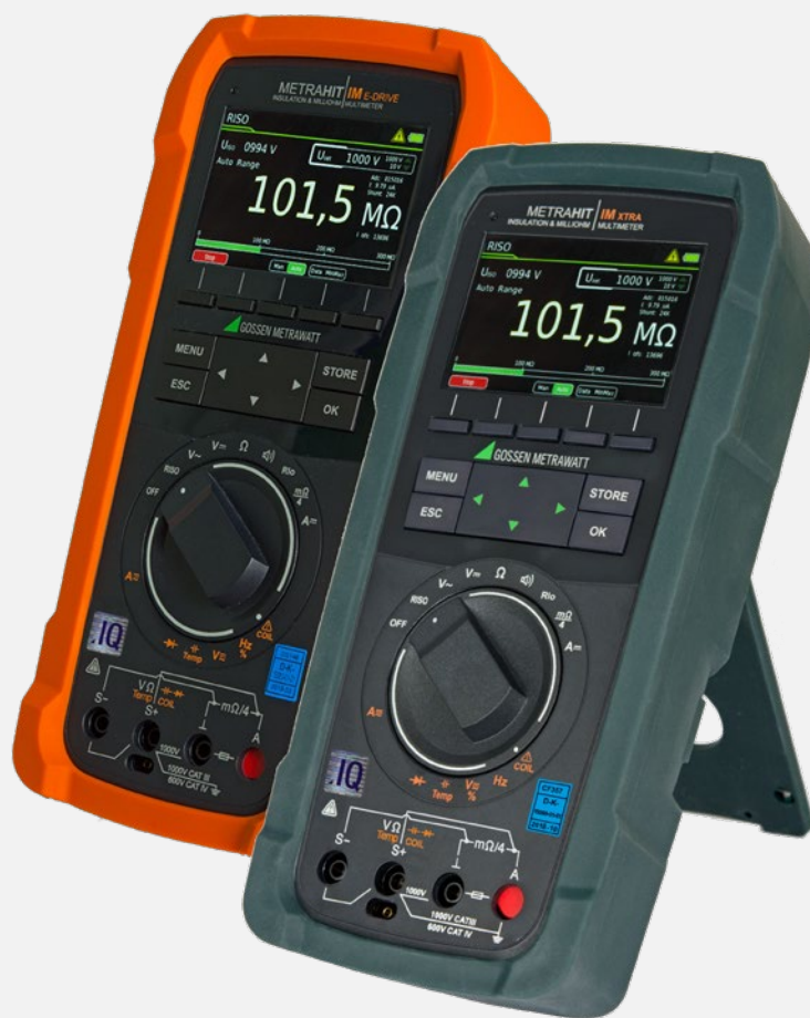
Мультиметры - портативные и компактные, для большей безопасности в самолетах

Должно быть обнаружено сопротивление всего в несколько миллиомов, а предельные значения должны быть проверены и записаны. Поскольку молниеотвод включает в себя последовательный разрядный путь, искрогаситель также должен быть проверен на правильность работы (после измерения низкого сопротивления) с помощью тестера изоляции (METRAHIT IM XTRA или METRAHIT ISO AERO).